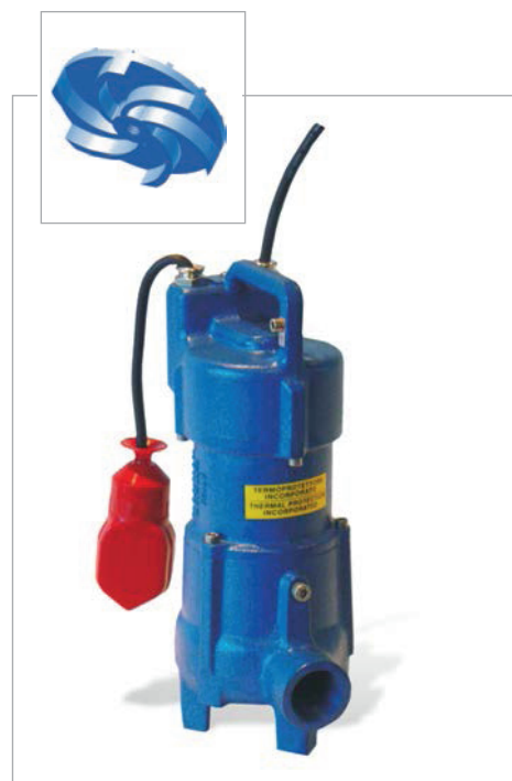
Pumphjul av virvelhjulstyp